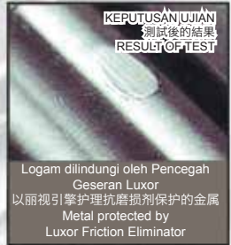
Logam dilindungi oleh Pencegah Geseran Luxor 以丽视引擎护理抗磨损剂保护的金属 Metal protected by Luxor Friction Eliminator