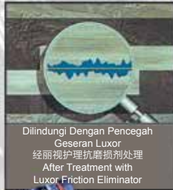
Dilindungi Dengan Pencegah Geseran Luxor 经丽视护理抗磨损剂处理 After Treatment with Luxor Friction Eliminator