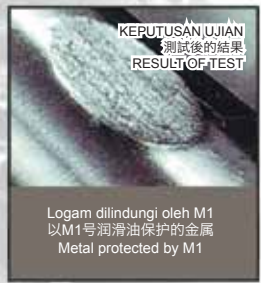
Logam dilindungi oleh M1 以M1号润滑油保护的金属 Metal protected by M1