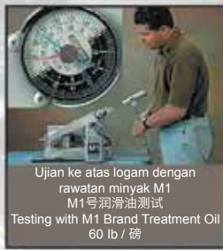
Ujian ke atas logam dengan rawatan minyak M1 M1号润滑油测试 Testing with M1 Brand Treatment Oil 60 lb / 磅