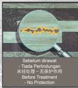
Sebelum dirawat - Tiada Perlindungan 未经处理 - 无保护作用 Before Treatment - No Protection